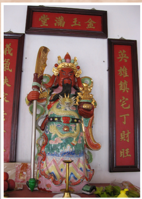
Autel de Guan Di

Le temple de Sanelong se fait plus discret. Ici, pas d'apparat. Une grande salle, avec la configuration habituelle: l'autel de Guan Di et l'autel des Ancêtres. C'est là que se réunissent, notamment pour « les fêtes des Morts », « ceux de Sanelong », du district de Shunde d'où sont originaires de nombreux Cantonais de l'île. C'est à leur initiative que cette association s'est créée, en 1919, afin d'héberger les nouveaux arrivants, les malades et les chômeurs, car « aucun émigré n'est seul et ne vit l'aventure de façon purement individuelle; avec lui, il draine toute une solidarité géographique (du district, de la province ou du dialecte) qui l'encadre dans la vie comme dans la mort » (Edith Wong-Hee-Kam. Les monuments et la mémoire)