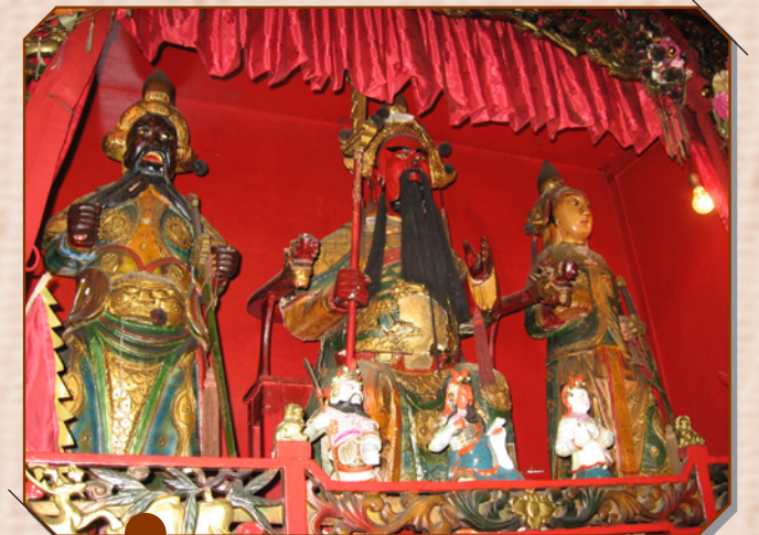
Temple des Chane

Une des fêtes les plus populaires célébrées par les chinois de La Réunion, est, sans conteste, l'anniversaire de la naissance de Guan Di. Elle a lieu le 24ème jour du 6ème mois lunaire, généralement en juillet-août. Les temples de Saint-Denis et de Saint-Pierre lui sont consacrés.