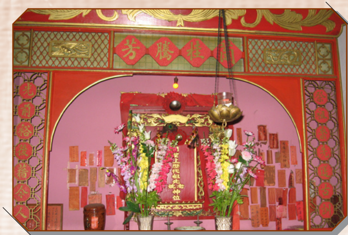
Autel des ancêtres

« She haiyang yimaoyi yaji Huatang » : Ceux qui ont traversé mers et océans afin de faire du commerce tiennent une réunion distinguée dans ce temple de Chine.