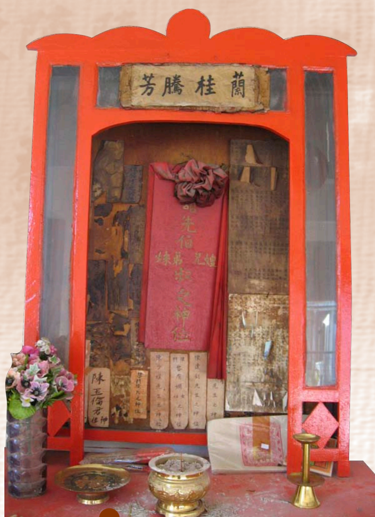
Autel des ancêtres

Le masque rouge qui orne le visage de Guan Di est symbole d'intégrité et de droiture. L'histoire raconte qu'un dignitaire corrompu avait enlevé une jeune femme pour en faire sa maîtresse. Guan Di vola au secours de la jeune captive et tua son ravisseur. Il se cacha dans un temple pour échapper à ses poursuivants, mais les soldats y mirent le feu. Guan Di les massacra tous. Les flammes lui ayant rougi le visage, il put quitter la ville incognito.