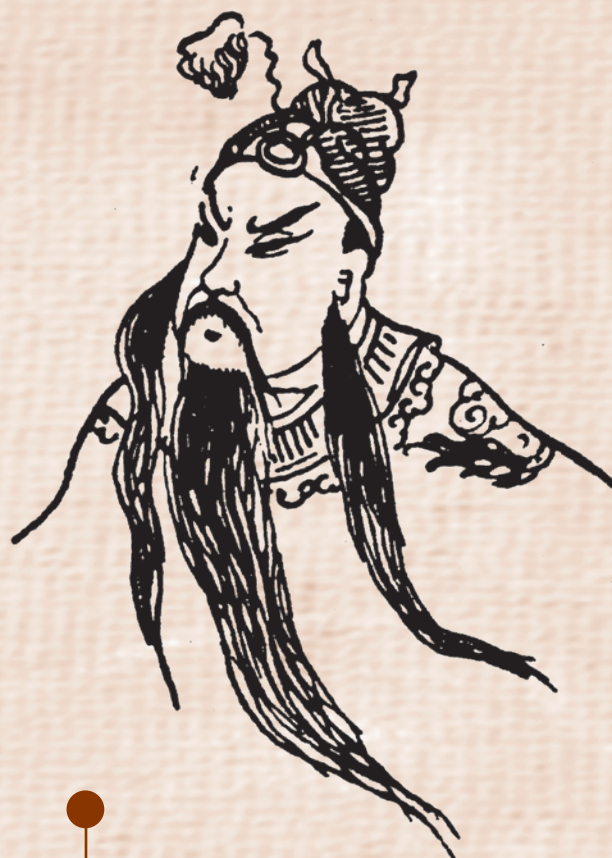
Le Seigneur " Belle-Barbe "

Il meurt, en l'an 220, massacré par ordre de l'empereur Sun Quan , régnant dans le royaume des Wu.