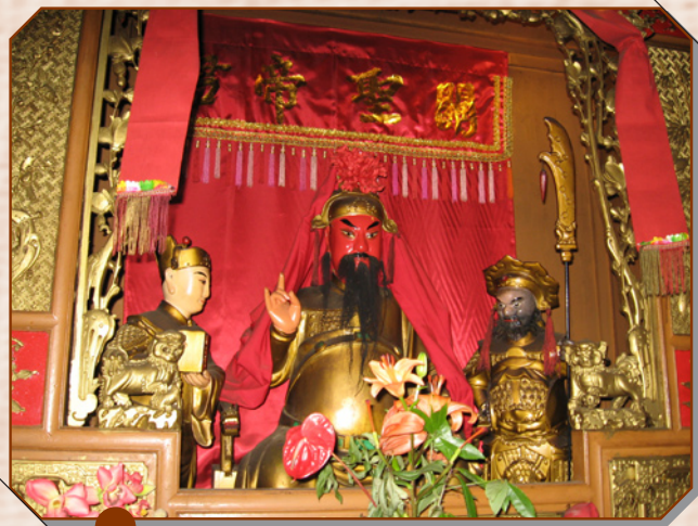
Temple des Law

Une des fêtes les plus populaires célébrées par les chinois de La Réunion, est, sans conteste, l'anniversaire de la naissance de Guan Di. Elle a lieu le 24ème jour du 6ème mois lunaire, généralement en juillet-août. Les temples de Saint-Denis et de Saint-Pierre lui sont consacrés.